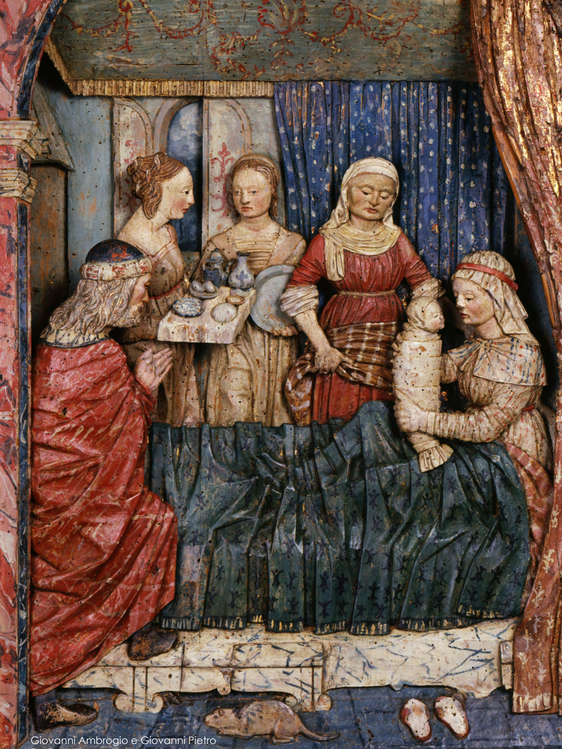
Giovanni Ambrogio e Giovanni Pietro De Donati, Nascita della Vergine , ante 1497, Lodi, Museo civico