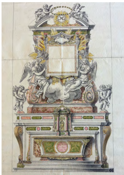
Filippo Juvarra, Altare dell'Incoronata , 1731-1732 circa. Lodi, Biblioteca Comunale Laudense