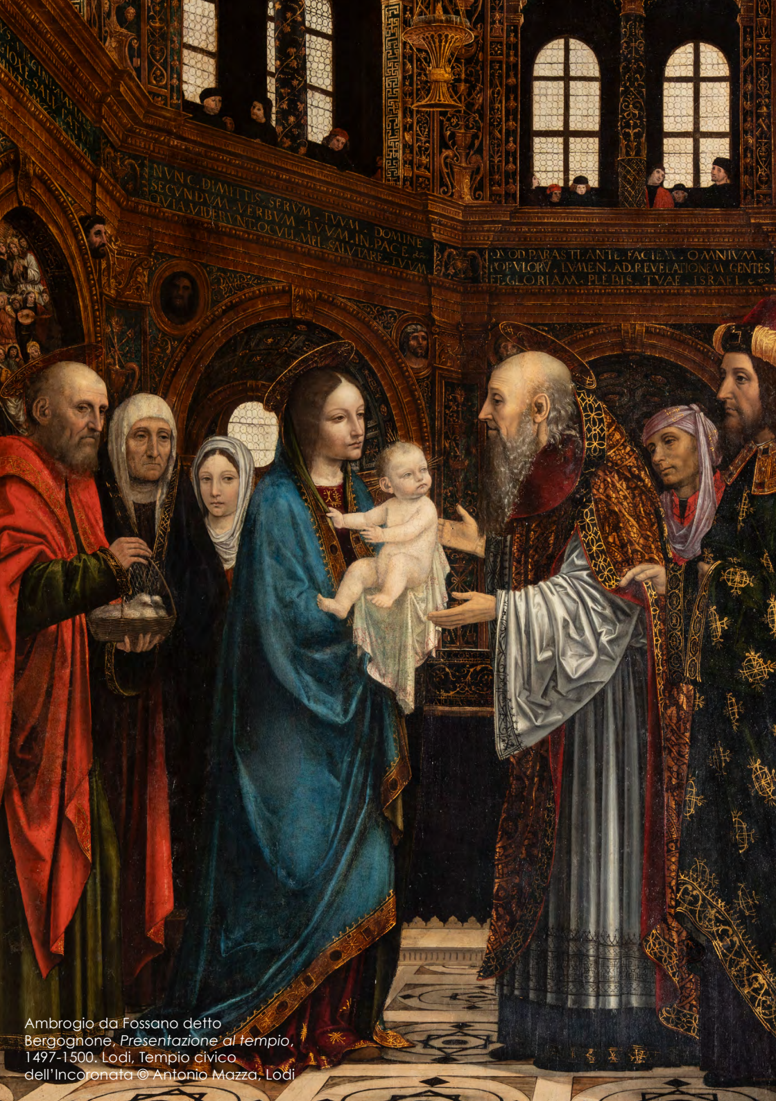
Ambrogio da Fossano detto Bergognone, Presentazione al tempio, 1497-1500. Lodi, Tempio civico dell'Incoronata